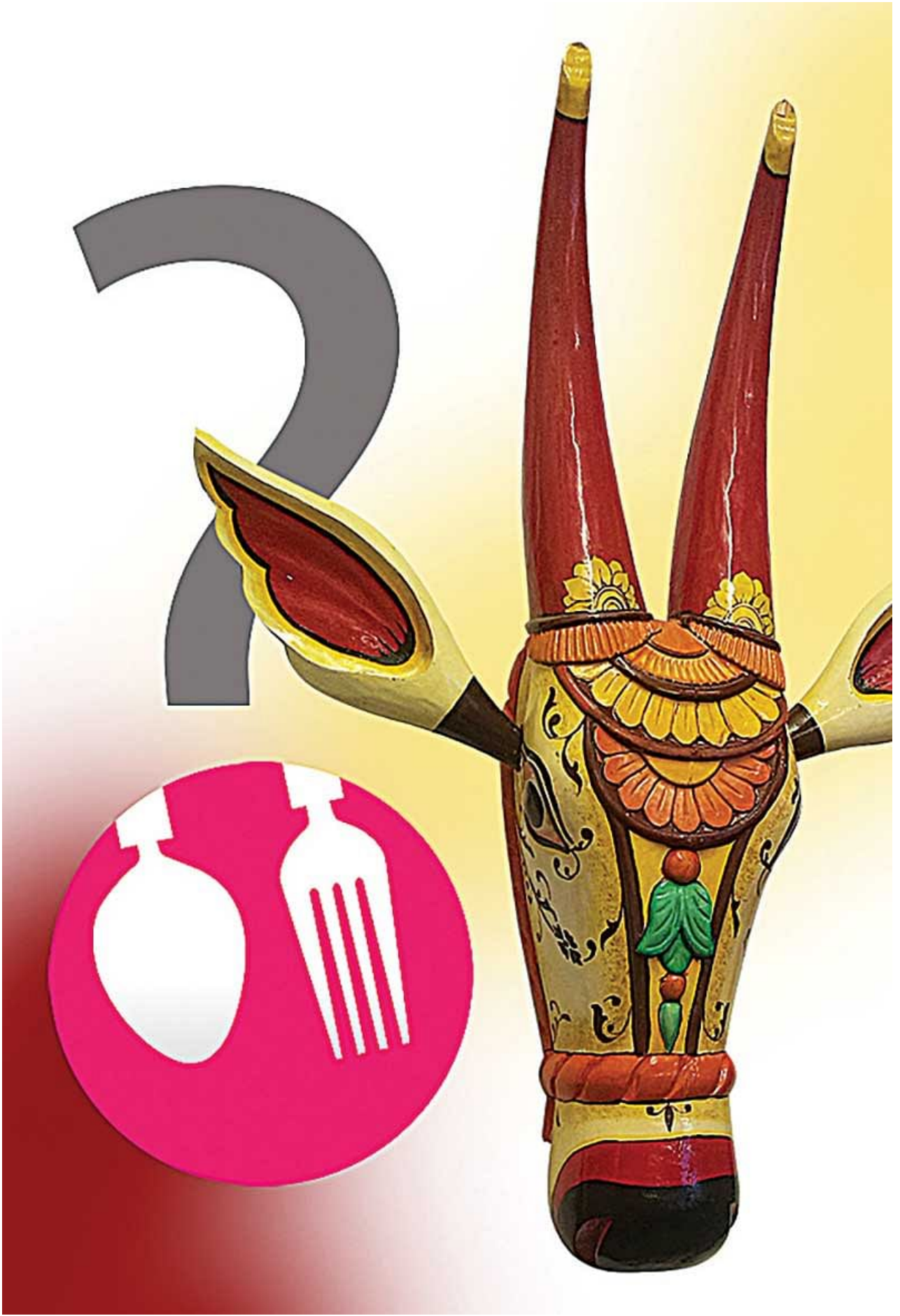
ದನ ಸಂಗ್ರಾಮದ ಅಪಾಯಕಾರಿ ಸಂದೇಶಗಳು