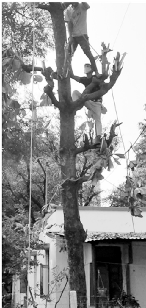
चित्र : मोंटी घुवें

गड्डे खोदना : विश्वकर्मा बताते हैं कि जो लोग गड्डे खोदने जाते हैं उनके पास गैती,