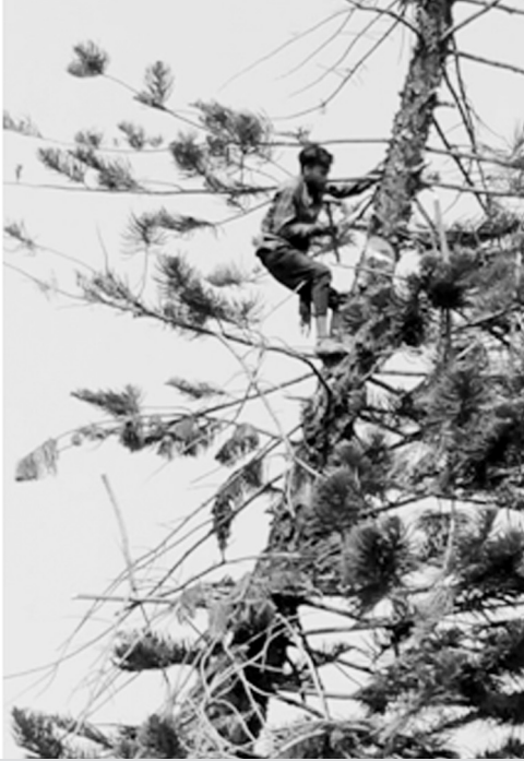
चित्र : मोटी धुवें

पेड़ काटना : पेड़ काटने का काम सीधे-सीधे गणितीय अवधारणा से नहीं जुड़ता, पर इसमें बहुत ज़्यादा अनुमान का गणित चलता है। कामगार साथियों ने बताया कि पेड़ काटने का काम बहुत रिस्की होता है। पेड़ काटकर गिराने से ज़्यादा पेड़ की छँटाई में वक्रत लगता है, क्योंकि पेड़ की छँटाई के लिए हर बड़ी डाल पर जाकर छोटी डालियाँ हटानी होती हैं और इसमें दो-तीन लोगों को पेड़ पर चढ़ना होता है तो काम जल्दी हो जाता है। इसलिए इस काम के हम ज़्यादा पैसे माँगते हैं, पेड़ ऊँचा और सीधा हो तो और ज़्यादा रिस्क रहता है। इस काम के लिए टँगिया (कुल्हाड़ी) और रस्सी का इस्तेमाल करते हैं। पेड़ की ऊँचाई और रिस्क देखकर भी हम पैसे तय करते हैं।