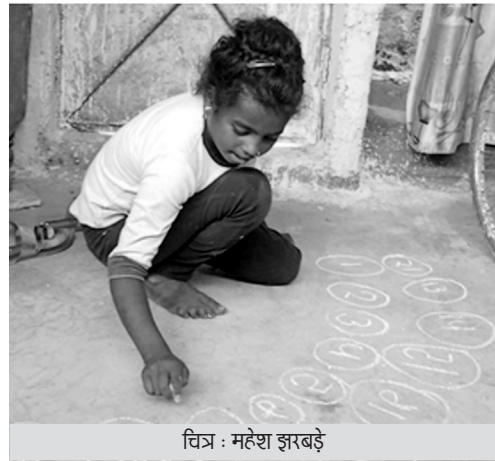
चित्र : महेश झरबड़े

लोगों के जीवन में चलने वाले गणित को समझने के लिए हमने कुछ चुनिन्दा समुदायों की दिनचर्या और उनके द्वारा किए जाने वाले कामों और उसमें निहित गणितीय अवधारणाओं